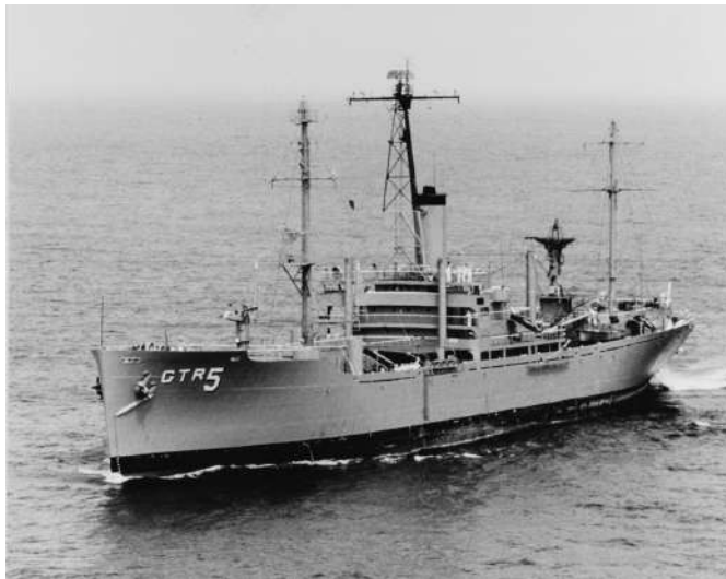
יו.א.א.ס. "ליברטי" (AGTR 5) בדרכה חזרה מהים התיכון, לאחר שיפוצה במלטה לאחר התקיפה. צולם במפרץ צ'ספיק, ארה"ב, 29/7/67

סרן יפתח ספקטור, מוביל מבנה "כורסה", הפנה ראשו אל מעבר לכתפו השמאלית כדי למקד מבטו במטרה תוך שגלגל את המיראז' 3CJ שלו לכיוון 100^{\circ} . 1 המטוס התגלגל החוצה מתוך הפנייה, חרטומו מישיר אל האוניה האפורה הזעירה שעל פני הים התיכון, כעשרת אלפים רגל מתחתיו.