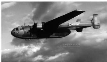
נוראטלס של חיל האוויר