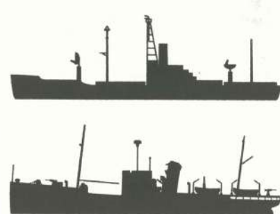
צלילות "ליברטי" (למעלה) ואל קוציר

כשהנורד נחת בערך ב-0700 בתום הסיור, תיאר צופה האוויר את האוניה ואת סימוני החרטום שלה - GTR 5 - לרס"ן אורי מרץ, שעילעל בשנתון "אוניות המלחמה של ג'יינס" וזיהה בבירור את האוניה כאוניית צי ארה"ב "ליברטי". 48 הוא העביר את המידע טלפונית לענף ים/4 בסטלה מאריס שבחיפה. 49 אורי מרץ ציין, כי "ליברטי" דמתה במראה לאוניה המצרית "אל קוציר" והזהיר את המודיעין הימי בחיפה לא לבלבל בין שתי האוניות. כשעה אחר כך, ב-0800 בערך, בתום משמרת של 24 שעות, הוחלף מרץ ברס"ן משה טבק.